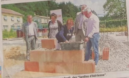
Lors de la pose de la première pierre, ce vendredi, des "Jardins d'Adrienne"

« que ce projet était à taille humaine, bénéfique pour la prospérité du village et qu'il devrait apporter une nouvelle dynamique pour la commune de Crépol ».