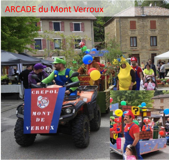
ARCADE du Mont Verroux