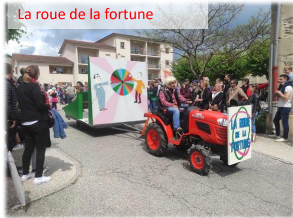
La roue de la fortune