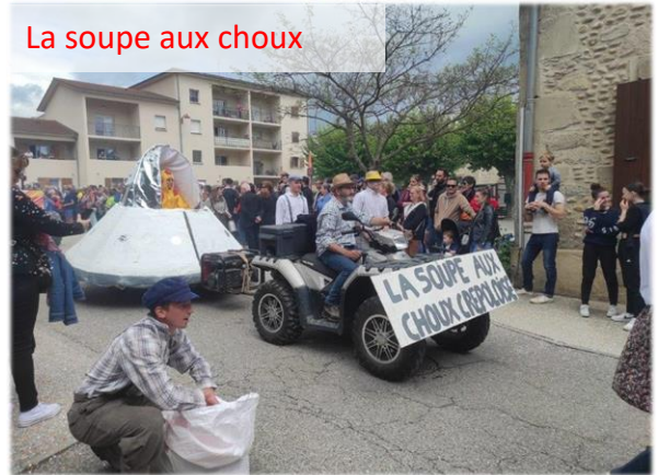
La soupe aux choux